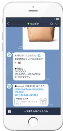
② なんぼや から返信