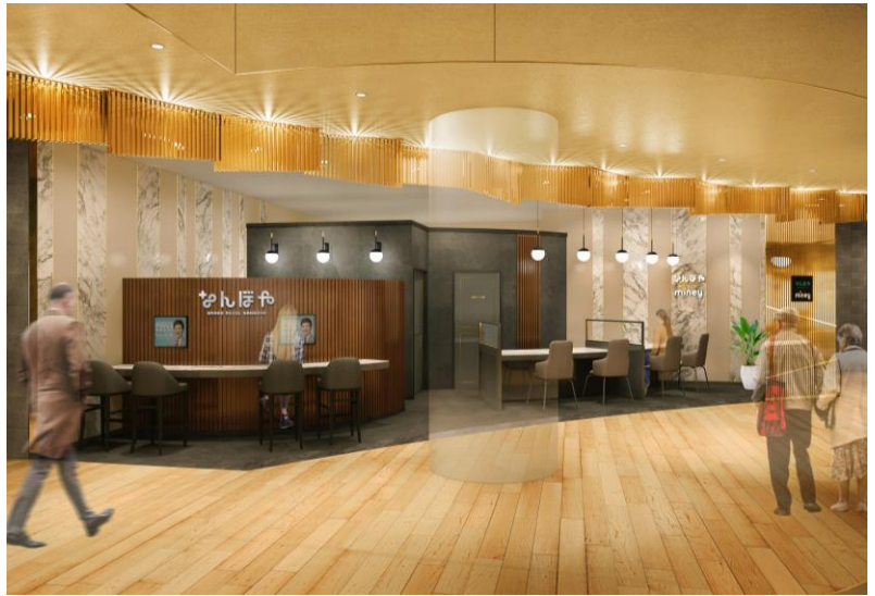
左：東急プラザ渋谷 外観イメージ / 右：なんぼや+miney 店舗イメージ