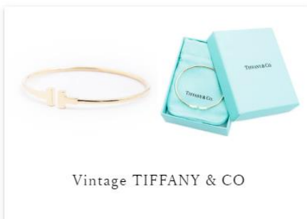
Vintage TIFFANY &amp; CO