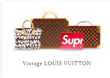
Vintage LOUIS VUITTON